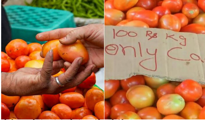
ಬೆಲೆ ಏರಿಕೆಯ ನಡುವೆಯೂ ಟೊಮೆಟೊ ಖರೀದಿ

ಬೆಂಗಳೂರು : ಟೊಮೆಟೊ ಬೆಲೆಗೆ: ಕೇಂದ್ರದ ನೇರ ರಂಗಪ್ರವೇಶ ಕೆ ಜಿಗೆ 200 ರೂ ದಾಟಿ ಮುನ್ನುಗ್ಗುತ್ತಿರುವ ಟೊಮೆಟೊ ದರ ನಿಯಂತ್ರಣಕ್ಕೆ ಭಾನುವಾರದಿಂದಲೇ ಕೇಂದ್ರ ಸರ್ಕಾರವು ನೇರವಾಗಿ ರಂಗಪ್ರವೇಶ ಮಾಡಿದ್ದು ದೇಶದ 500 ಕಡೆಗಳಲ್ಲಿ ಕೆ.ಜಿಗೆ 80 ರೂ.ದರದಲ್ಲಿ ಮಾರಾಟ ಮಾಡುತ್ತಿದೆ. ಟೊಮೆಟೊ ದರ ಕೆ.ಜಿಗೆ 200 ರೂ. ದಾಟಿರುವ ಉತ್ತರ ಭಾರತದ ರಾಜ್ಯಗಳು ಮಾತ್ರವಲ್ಲದೆ ದೇಶಾದ್ಯಂತ ಕೆ.ಜಿಗೆ 80 ರೂ. ದರದಲ್ಲಿ ಮಾರಾಟ ಆರಂಭಿಸಲಾಗಿದೆ. ಆಯಾ ನಗರಗಳ ಮಾರುಕಟ್ಟೆ ಬೆಲೆಗಳನ್ನು ಅವಲಂಬಿಸಿ ಸೋಮವಾರದಿಂದ ಮತ್ತಷ್ಟು ನಗರಗಳಿಗೆ ಈ ಸೌಲಭ್ಯ ವಿಸ್ತರಿಸಲಾಗುವುದು ಎಂದು ಗ್ರಾಹಕ ವ್ಯವಹಾರಗಳ ಸಚಿವಾಲಯದ ಪ್ರಕಟಣೆ ತಿಳಿಸಿದೆ. ಸಹಕಾರ ಕ್ಷೇತ್ರದ ರಾಷ್ಟ್ರೀಯ ಕೃಷಿ ಸಹಕಾರ ಮಾರುಕಟ್ಟೆ ಒಕ್ಕೂಟ (ನಾಫೆಡ್) ಮತ್ತು ಭಾರತೀಯ ರಾಷ್ಟ್ರೀಯ ಗ್ರಾಹಕರ ಸಹಕಾರ ಒಕ್ಕೂಟ (ಎನ್ ಸಿ ಸಿ ಎಫ್) ಗಳ ಸಂಚಾರಿ ಮಳಿಗೆಗಳ ಮೂಲಕ ರಿಯಾಯಿತಿ ದರದಲ್ಲಿ ಮಾರಾಟ ಮಳಿಗೆಗಳ ಮೂಲಕ ರಿಯಾಯಿತಿ ದರದಲ್ಲಿ ಮಾರಾಟ