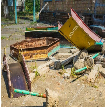
ಕ್ರೀಡಾ ಮೈದಾನದ ದುರೈ ವ್ಯವಸ್ಥೆ

ಸಹ ಈ ರೀತಿ ಸುಳ್ಳು ಹೇಳುವ ಮೂಲಕ ಶುಲ್ಕ ಪಾವತಿಸಿಕೊಳ್ಳುವುದನ್ನು ಬಿಟ್ಟು ಆಟದ ಮೈದಾನ, ಉತ್ತಮ ತರಬೇತಿ, ನೀಡುವ ಮೂಲಕ ಉತ್ತಮ ಕ್ರೀಡಾಪಟುಗಳನ್ನು ಬೆಳೆಸಬೇಕಾಗಿದೆ.