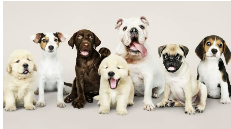
ವಿವಿಧ ರೀತಿಯ ಶ್ವಾನಗಳ ದೃಶ್ಯ

ಶ್ವಾನ ಮಾಲೀಕರ ಹಕ್ಕುಗಳು ಭಾರತದ ಅನಿಮಲ್ ವೆಲ್‌ಫೇರ್ ಬೋರ್ಡ್ ಪ್ರಾಣಿಗಳ ರಕ್ಷಣೆಗೆ ವಿವಿಧ ಕಾನೂನುಗಳನ್ನು ರೂಪಿಸಿದ್ದು, ಇದರ ಪ್ರಕಾರ, ಸಾಕುನಾಯಿ ಹೊಂದಿರುವವರಿಗೆ ಕೆಲವು ಹಕ್ಕುಗಳನ್ನು ನೀಡಿದೆ. ಈ ಹಕ್ಕುಗಳಲ್ಲಿ ಕೆಲವು ಅಪಾರ್ಟ್ ಮೆಂಟ್ ವಾಸಿಗಳಿಗೆ ಉಪಯುಕ್ತ. 1. ಇದರ ಪ್ರಕಾರ ಅಪಾರ್ಟ್‌ಮೆಂಟ್ ನಿವಾಸಿಗಳ ಕ್ಷೇಮಾಭಿವೃದ್ಧಿ ಸಂಘವು ತನ್ನ ಕಟ್ಟಡದಲ್ಲಿರುವ ಫ್ಲಾಟ್ ನಿವಾಸಿಗಳಿಗೆ ನಾಯಿ ಸಾಕುವುದನ್ನು ನಿಷೇಧಿಸುವಂತಿಲ್ಲ. ಅಪಾರ್ಟ್‌ಮೆಂಟ್ ನ ಬಹುಸಂಖ್ಯಾತ ನಿವಾಸಿಗಳು ಸಾಕುಪ್ರಾಣಿ ನಿಷೇಧಕ್ಕೆ ಸಮ್ಮತಿ ತೋ- ರಿದರೂ ಅದು ಕಾನೂನುಬಾಹಿರವಾಗುತ್ತದೆ. 2.ಅಪಾರ್ಟ್‌ಮೆಂಟ್ ನಿವಾಸಿಗಳ